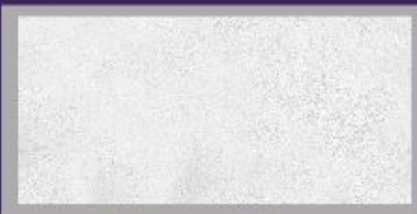
Partículas de Mica