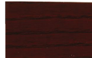
Sapelly • Sapelly