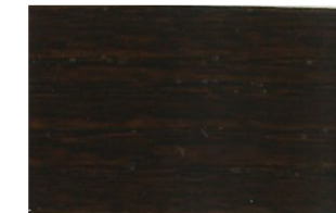
Nogal • Nogueira