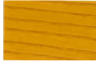
Pino • Pinho