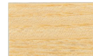
Incoloro Brillante • Incolor Brilhante