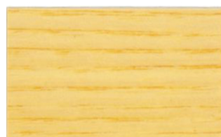
Incoloro Satinado • Incolor Acetinado