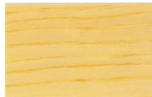
Incoloro • Incolor