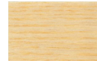
Incoloro Satinado • Incolor Acetinado