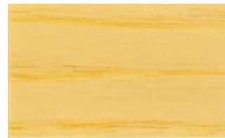
Incoloro • Incolor