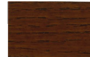
Roble Oscuro • Carvalho Escuro