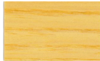
Incoloro • Incolor