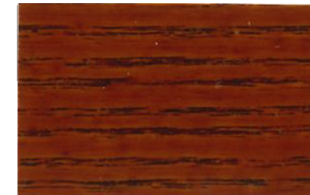
Sapelly • Sapelly