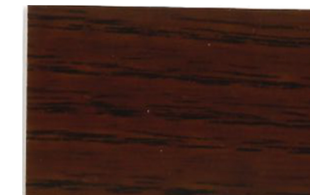
Roble Oscuro • Carvalho Escuro