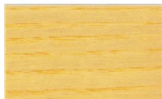
Incoloro Brillante • Incolor Brilhante