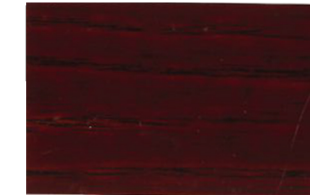
Caoba • Mogno