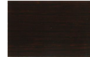
Nogal • Nogueira