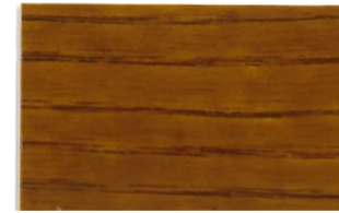
Roble Claro • Carvalho Claro