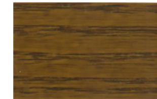
Castaño • Castanho