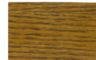
Castaño • Castanho