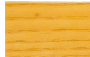
Incoloro Brillante • Incolor Brilhante