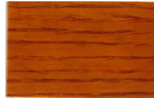
Avellana • Avelã