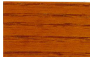
Avellana • Avelã