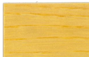
Incoloro Brillante • Incolor Brilhante