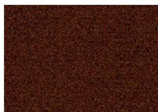
MARRÓN ÓXIDO / CASTANHO ÓXIDO