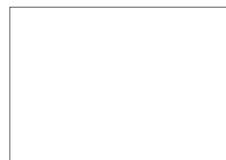
BLANCO / BRANCO