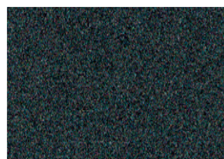
NEGRO / PRETO